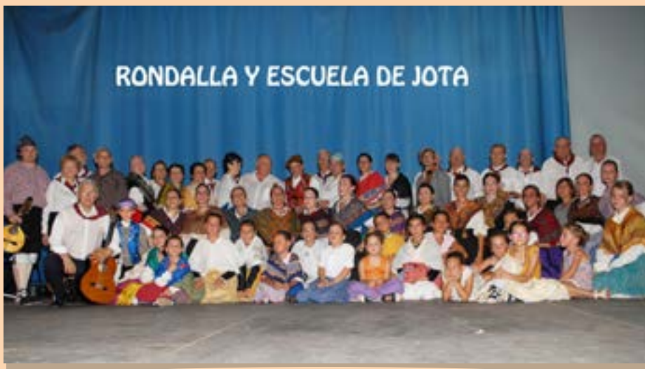
Rondalla y Escuela de Jota, 2015