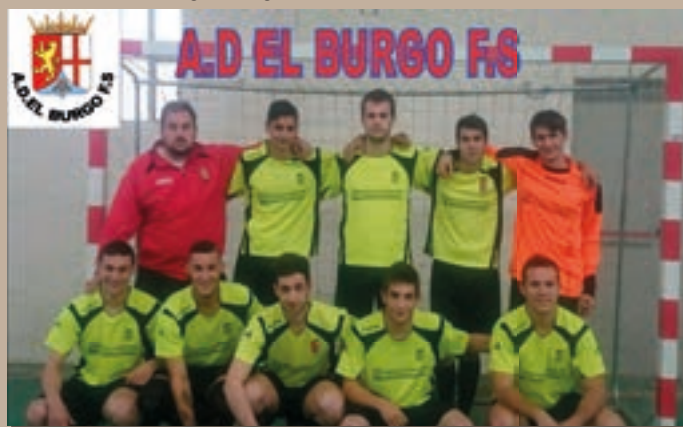
A.D. El Burgo, F.S. Senior Masculino 2014–2015