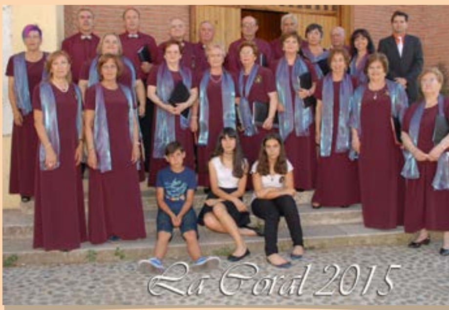
Coral Municipal, 2015