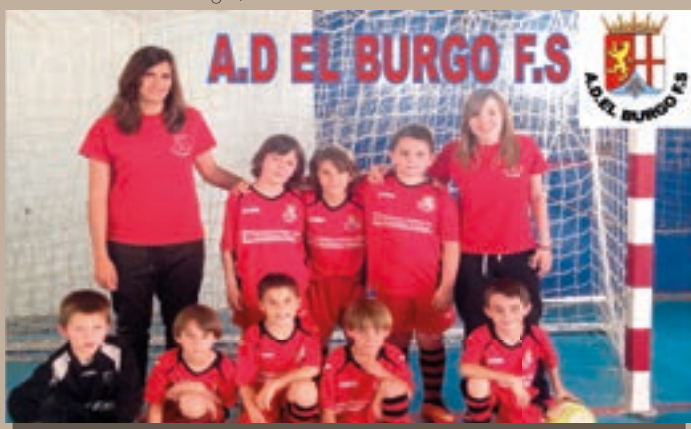
A.D. El Burgo, F.S. Iniciación 2015