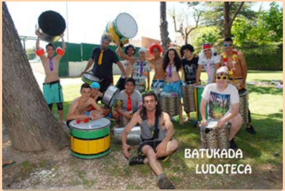
Batukada Ludoteca, 2015