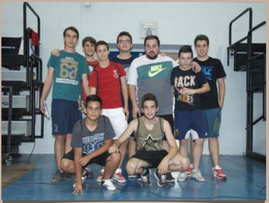
A.D. El Burgo, F.S. Cadete Juvenil, 2014–2015