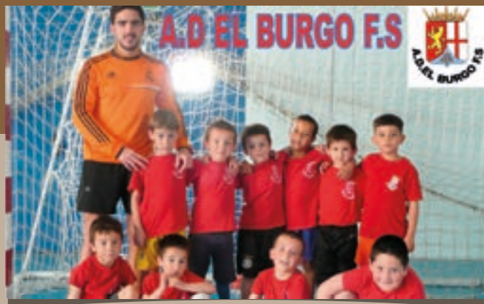
A.D. El Burgo, F.S. Escuela II Año 2014–2015