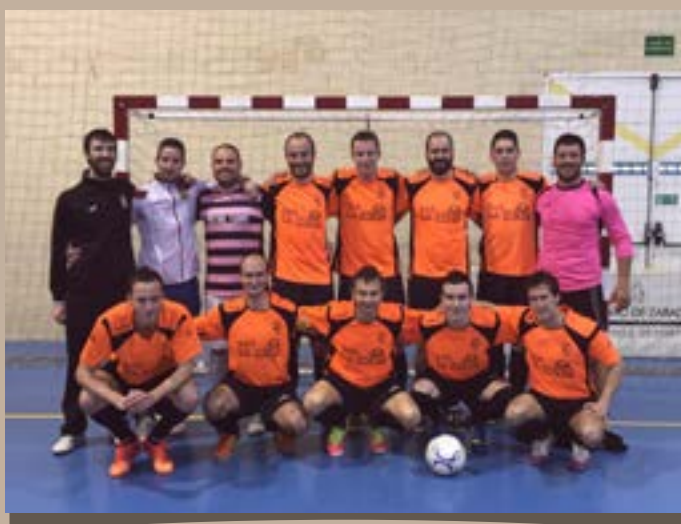
Bar La Pista, El Burgo F.s. 2015