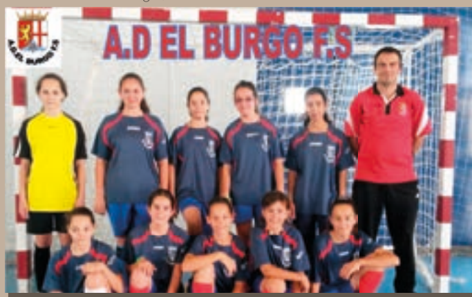
A.D. El Burgo, F.S. Alevín Femenino 2014–2015