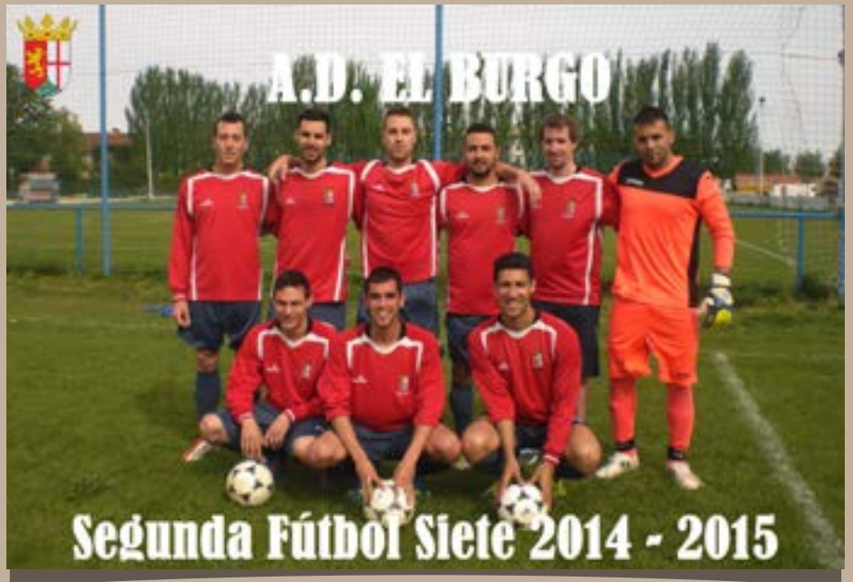
A.D. El Burgo, Segunda Fútbol Siete, 2014–2015