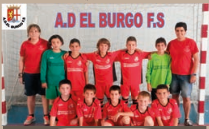
A.D. El Burgo, F.S. Benjamín 2014–2015