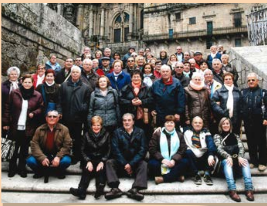
Asociación de Jubilados y Pensionistas San Jorge