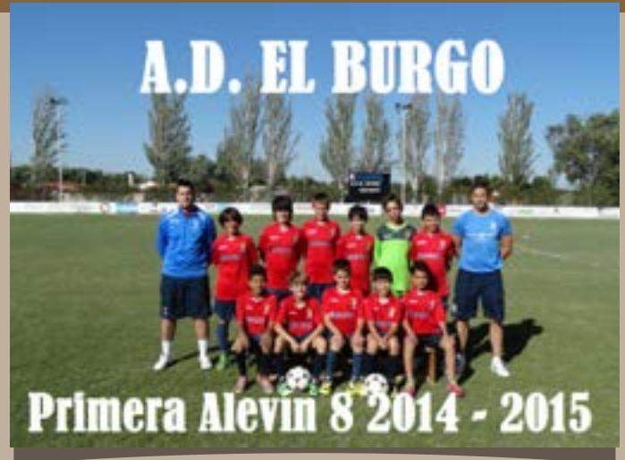
A.D. El Burgo, F8 Alevín 2014–2015