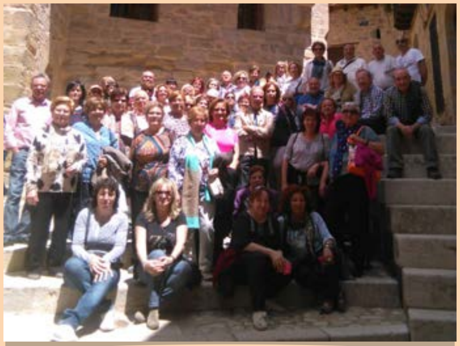
Asociación de mujeres El Álamo