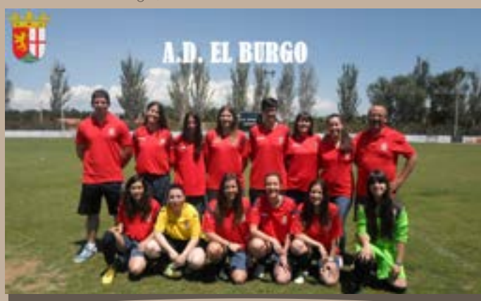
A.D. El Burgo, Segunda Autonómica 2014–2015