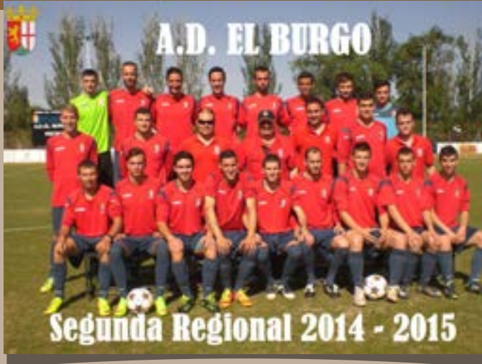
A.D. El Burgo, Segunda Regional 2014–2015