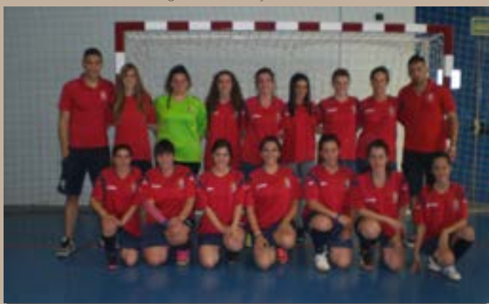
A.D. El Burgo, Segunda Autonómica Sala B, 2014–2015