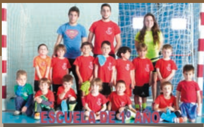
A.D. El Burgo, F.S. Escuela I Año 2014–2015