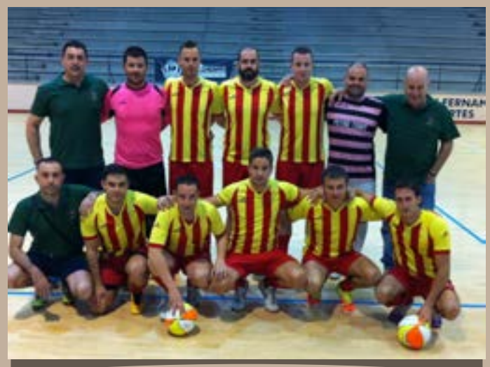
Rayo El Burgo