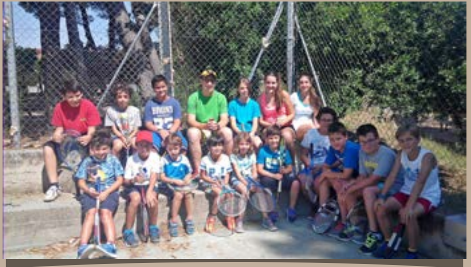
A.D. Tenis, 2015